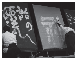
“こころ”のふれあうフェスタ2020 8.7(土) メディキット県民文化センター