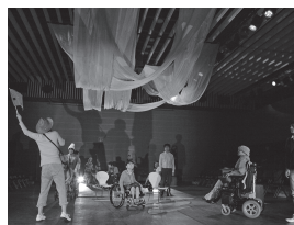
演劇公演「ゆかいアート村 はじまり物語」 7.10(土)・11(日) 三股町立文化会館

詳細やその他のイベントについては「国文祭・芸文祭みやざき2020」大会ホームページをご覧ください。