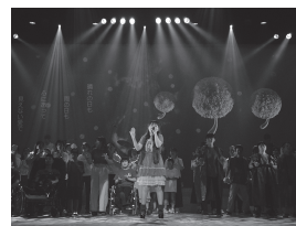
第40回わたぼうし宮崎コンサート2020 8.22(日) 宮崎市民文化ホール