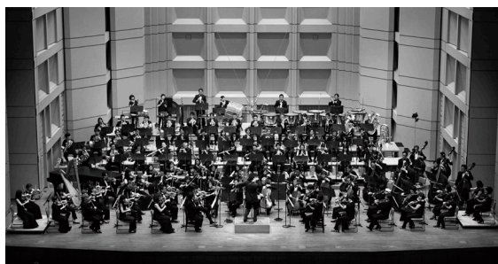
東京フィルハーモニー交響楽団(管弦楽)