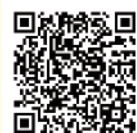
詳細 HPリンク QR

窓口 東京都豊島区東池袋1-20-10 としま区民センター1階 (10:00~19:00 ※臨時休業あり)