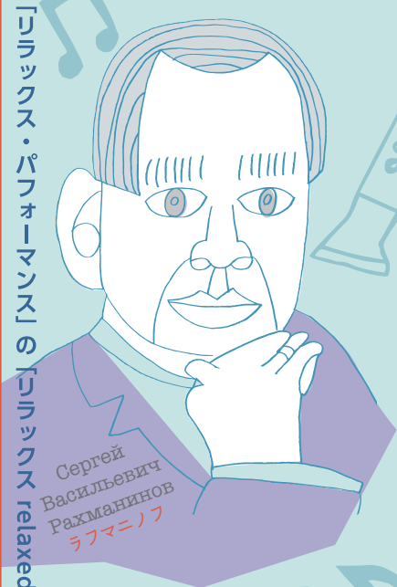
Сергей Васильевич Рахманинов ラフマニノフ