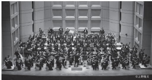
東京フィルハーモニー交響楽団（管弦楽）