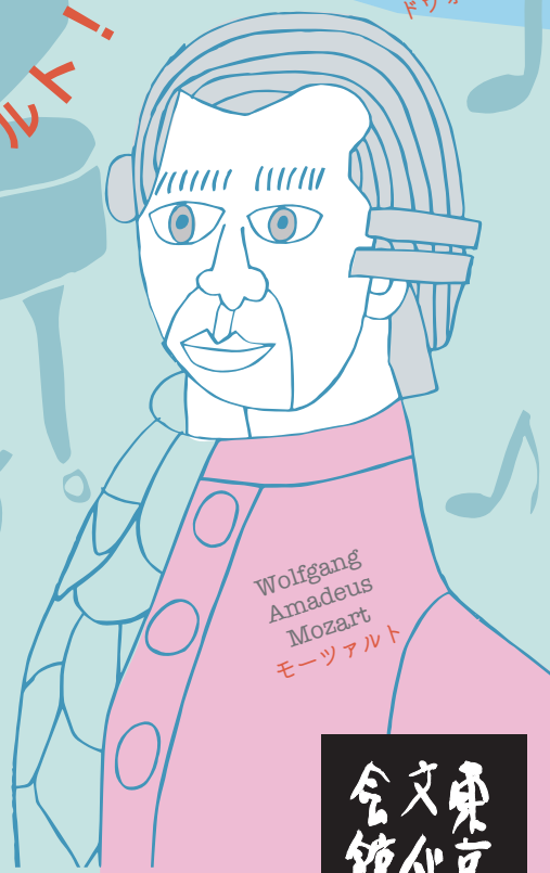
Wolfgang Amadeus Mozart モーツァルト

「リラックス・パフォーマンス」の「リラックス relaxed」は寛容なという意味。少し音をたてても、身体が動いても、大丈夫。みんなで一緒に音楽を楽しめる公演です。