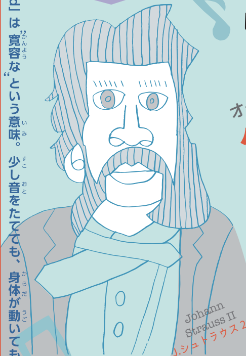
Johann Strauss II J.シュトラウス2世