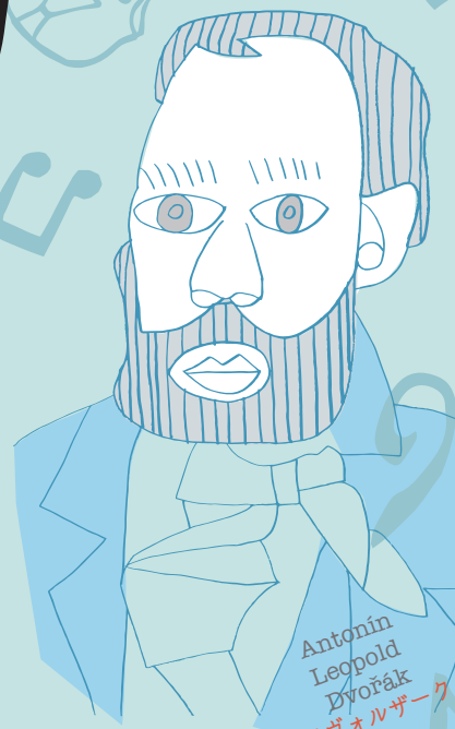
Antonín Leopold Dvořák ドヴォルザーク